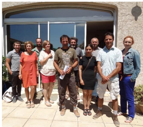
Les participants de l'AG constitutive du réseau le 4 juillet 2016