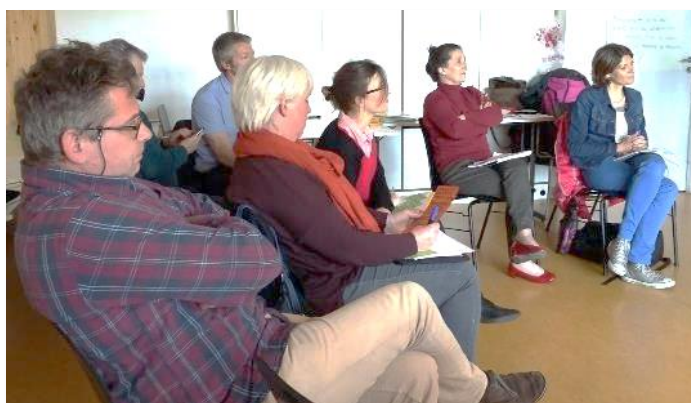
Bienvenue A la Ferme, Boutiques Paysannes, le Réseau des producteurs de Provence-Alpes-Côte d'Azur, Terre d'Envies et l'Union des points de vente de collectif de Nord-Pas-de Calais, AGC CEGAR, réseau CIVAM étaient présents

Le 3 avril 2017, à Paris, Trame a animé la première rencontre inter-réseaux des magasins de producteurs pour échanger sur les enjeux du développement des magasins de producteurs à l'échelle nationale. Lors de cette rencontre, les 5 réseaux existants de magasins de producteurs étaient présents, ainsi que deux structures qui accompagnent l'émergence de réseaux et des adhérents de Trame qui souhaitent développer les liens et la mise en réseau. Lors de cette journée, les différents réseaux ont pu faire connaissance, partager un diagnostic de la situation actuelle des magasins de producteurs et définir des axes de travail. A l'issue de la rencontre, l'ensemble des participants nous a livré sa satisfaction face à cette initiative et a souhaité poursuivre ce travail collectif, notamment sur des questions règlementaires.