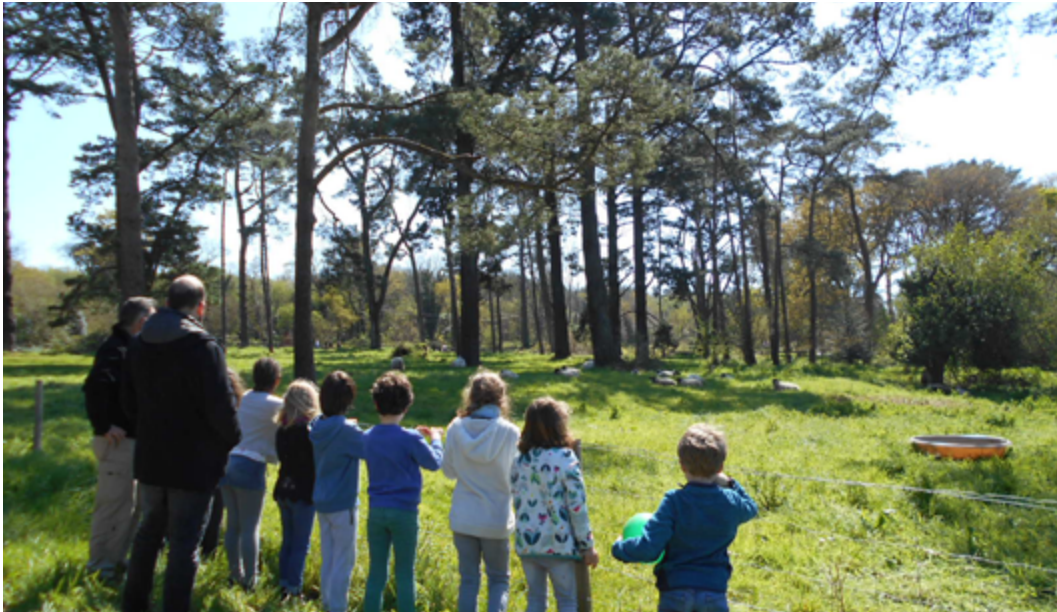
écopâturage à Arc'Hantel, avril 2019.