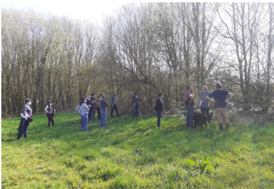
Territoire de la Vallée de la Seiche : journée au pied de la haie